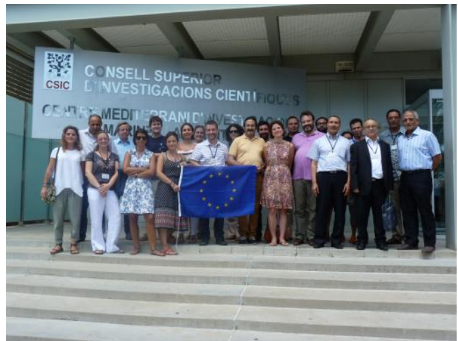
Socios y asociados del Proyecto ECOSAFIMED que contribuyeron al debate en materia de políticas marinas internacionales en el encuentro que tuvo lugar en el Instituto de Ciencias del Mar del CSIC el 23 de julio en Túnez

La 5ª reunión del Comité de Gestión del proyecto ECOSAFIMED tuvo lugar durante los días 21 y 22 de julio de 2015 en Barcelona. A continuación, el día 23 de julio se celebró un encuentro con diferentes organizaciones colaboradoras con el proyecto con el objetivo de exponer los principales resultados preliminares. Entre las entidades que participaron se encontraron el Ministerio de Agricultura, Alimentación y Medio Ambiente de España, el Ministerio de Agricultura, Recursos Hídricos y Pesca de Túnez, la Comisión General de Pesca del Mediterráneo, la Unión Internacional de Conservación de la Naturaleza, el Centro Regional de Actividad para las Áreas especialmente protegidas del Convenio de Barcelona, MedPAN, la Unión Tunecina para la Agricultura y la Pesca y el Instituto para el ambiente marino y costero del Consejo Nacional de Investigación de Italia. Los asociados expresaron su disposición total a apoyar y difundir los resultados del proyecto, en particular las recomendaciones de buenas prácticas de pesca artesanal amparadas en los datos científicos obtenidos a través de la realización de campañas oceanográficas y de pesca en el marco del proyecto.