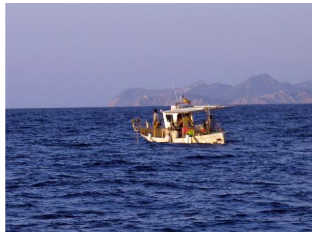
Embarcación artesanal de 8 metros pescando en el Canal de Menorca