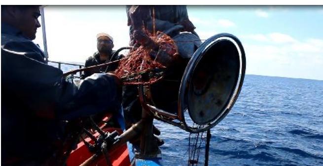
Recogida de las redes de trasmallo para langosta en el banco de Eskerquis (mayo de 2015)

Llevo más de 30 años faenando, 25 de los cuales he dedicado a la captura de la langosta roja. En Bizerta hay aproximadamente 20 embarcaciones especializadas en la captura de langostas. La temporada de pesca comienza en la zona de la isla de La Galite; después, algunos de los pescadores se desplazan a la zona del banco de Eskerquis mientras yo continúo faenando en La Galite, aprovechándome del abrigo que proporciona su pequeño puerto frente a condiciones meteorológicas adversas. Utilizo unas redes de trasmallo –que en Túnez llamamos "mbatten"– con un tamaño de malla de 80 mm.