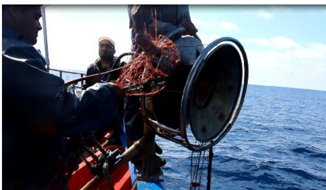
Recupero di un tramaglio nel banco di Esquerquis (maggio 2015)

Lavoro come pescatore da più di 30 anni e per 25 di questi anni mi sono occupato della pesca di aragoste. A Bizerte ci sono circa 20 barche da pesca specializzate nella pesca dell'aragosta. Iniziamo la campagna di pesca professionale nella zona dell'isola di La Galite. Successivamente, alcuni pescatori si dirigono verso la zona del banco di Esquerquis, mentre io rimango vicino a La Galite, perché posso ripararmi nel suo piccolo porto se le condizioni del tempo peggiorano. Utilizzo tramagli, che in Tunisia vengono chiamati "mbatten" con dimensioni della maglia di 80 cm.