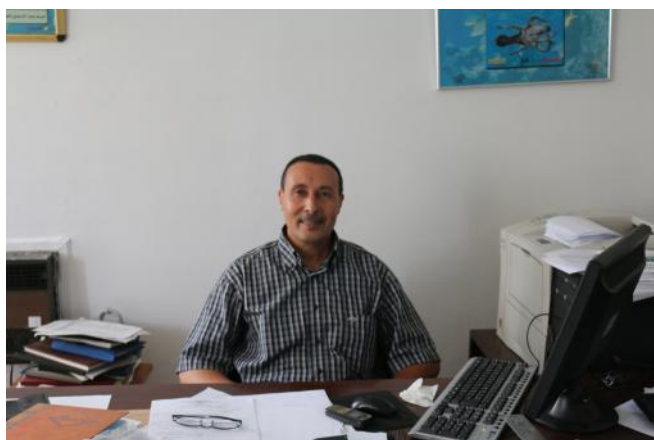
Il sig. Mehrez Besta, Direttore della Direzione generale di Pesca e acquacoltura (DGPA) in Tunisia

ECOSAFIMED è un progetto pionieristico con un innovativo approccio partecipativo che si rivolge alla zona di pesca artigianale della Tunisia settentrionale, avvicinandosi alle esigenze ed alle preoccupazioni dei pescatori. I pescatori tentano sempre di incrementare il loro pescato. Senza dubbio la loro attività è a rischio di estinzione a causa dell'elevata pressione di pesca, alla diminuzione della popolazione di pesci e alla competizione con i pescatori più ricchi. Penso che questa sensazione sia condivisa da tutti i pescatori artigianali del Mediterraneo.