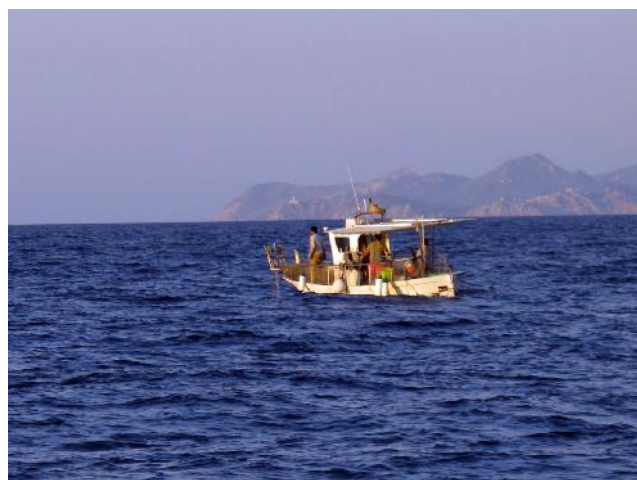
Imbarcazione artigianale di 8 metri mentre pesca nel Canale di Minorca.

L'età media delle barche è stata calcolata rispetto al 2014 ed è di circa 30 anni. La maggior parte delle imbarcazioni sono fabbricate in vetroresina (il 58% del totale della flotta artigianale).